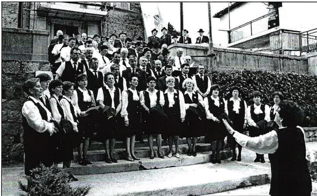
Klanjski Zbor bio je domaćin III. susreta hrvatskih lovskih rogista i zborova 29. svibnja 1999. Na slici zajednički nastup svih sudionika susreta na stepeništu crkve Sv. Jerolima.

Zbor je u znak priznanja dobio priliku da 1991. godine bude domaćin i organizator 18. Srećanja. Preuzetu obvezu obavio je tako dobro da je odlikovan od lovačkog saveza Slovenije zbog izvrsne organizacije i gostoljubivosti. Hrvatski lovački savez još je tri puta pozivao klanjski zbor na svoje manifestacije. 12. prosinca 1992. godine zbor je pozvan na proslavu 100. obljetnice "Lovačkog vjesnika", 25. prosinca 1995. godine na I. Lovački bal lovačkog saveza Hrvatske, te na prvu lovačku izložbu Hrvatske "Lovac - priroda - divljač" 23. ožujka 1996. godine.