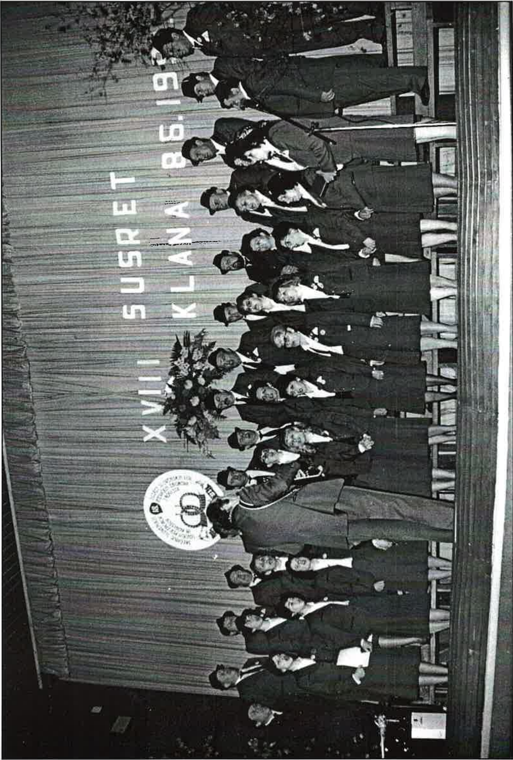
U ljeto 1991. Zbor je bio domaćin XVIII. po redu Srećanja lovskih zborova in registov.