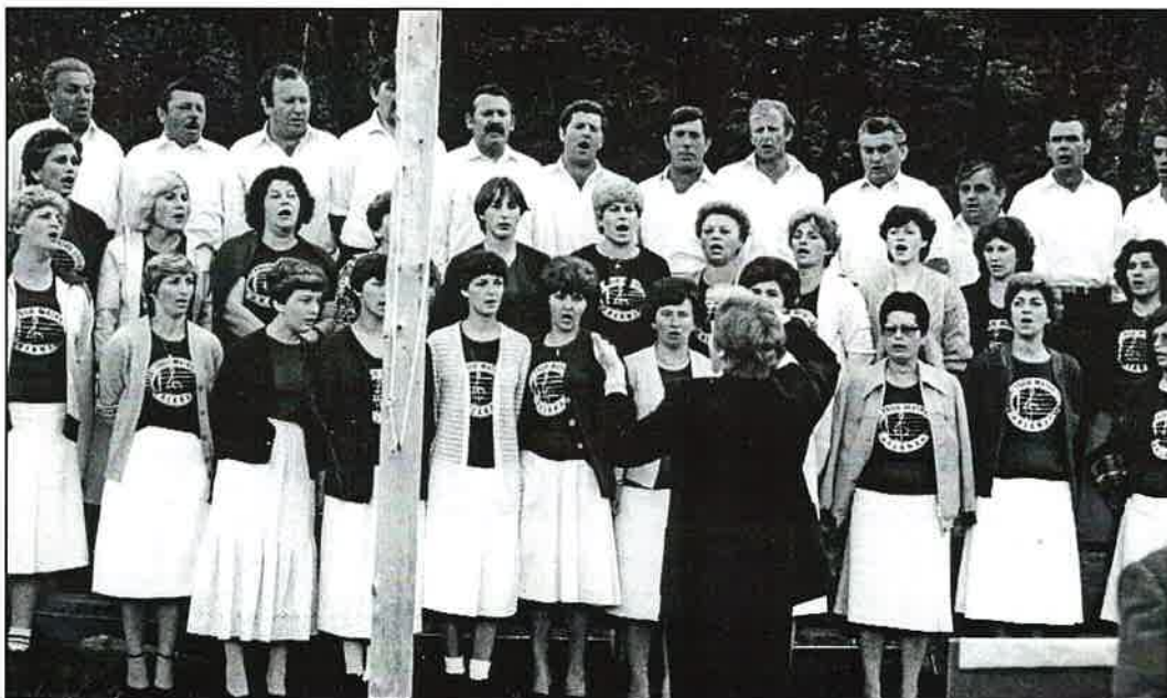
Zbor je u ljeto 1981. godine svojim nastupom oplemenio takmičenje sjekača šumarija Šumskog gospodarstva Delnice održanom u Klani.

Od prvoga dana rada Zbora sudjeluje velik broj pjevača iz većine mjesta našega kraja, najviše iz Klane. No, Zbor nikada nije okupio sve izuzetno kvalitetne pjevače, koje je Klana imala. Članska disciplina, redovito pohađanje proba, podređivanje svojih poslova društvenim, neki najkvalitetniji nisu mogli prihvatiti, pa je njihova pomoć zboru izostala, a slušatelji su ostali prikraćeni za njihovu pjesmu.