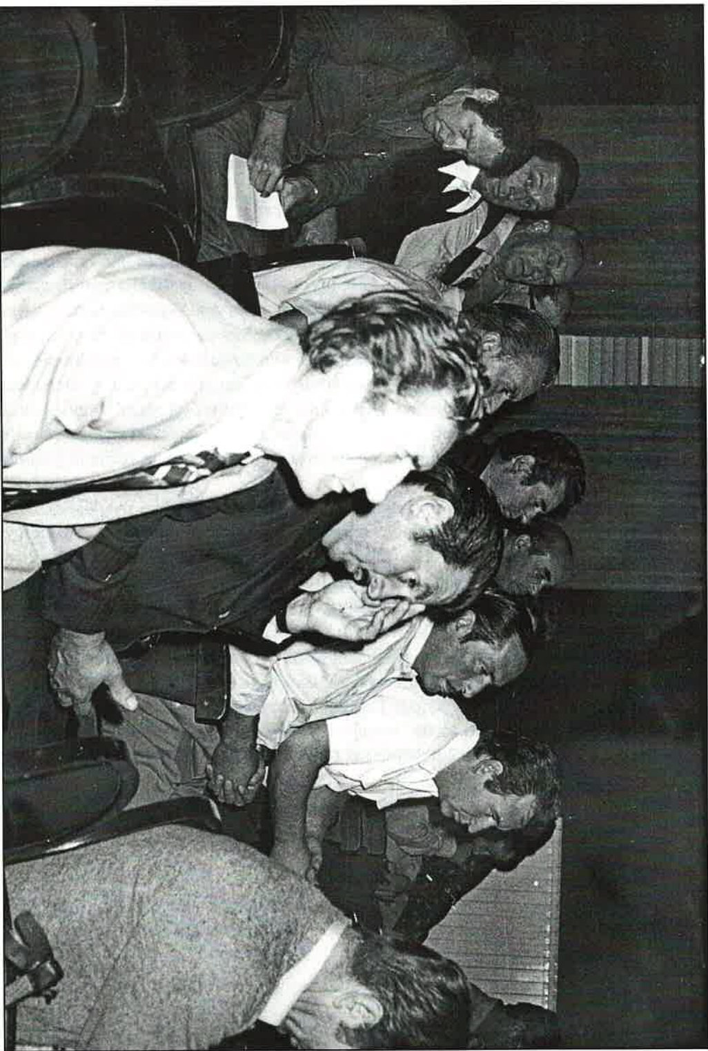
Dio sudionika osnivačke skupštine Zbora 4. srpnja 1979.