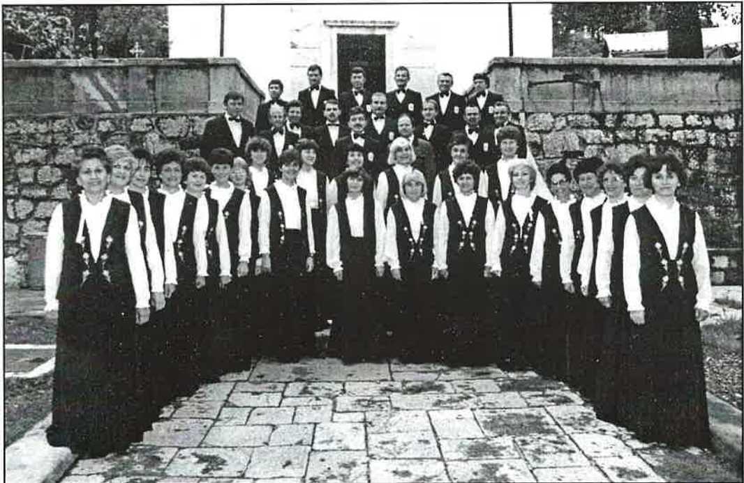
Zbor u prosincu 1980., godinu dana nakon prvoga nastupa u svojim prvim kostimima.

Rezultati rada i uloženoga truda u cjelokupne pripreme došli su do izražaja 26. studenog 1979. godine, na dan prvoga nastupa Zbora pod ravnanjem maestra Dušana Prašeljca. Taj će nastup ostati zapisan kao jedan od najvažnijih kulturnih događaja u povijesti ovoga kraja. Samome nastupu prethodilo je otkrivanje spomen ploče Ivanu Matetiću Ronjgovimu na zgradi Osnovne škole Klana, u znak sjećanja na njegov rad u Klani početkom stoljeća. Klanjska kino dvorana na večer je bila premala da primi sve one koji su htjeli pratiti prvi nastup Zbora. Zbog izuzetno uspješnoga nastupa Zbora, ali i zbog nastavljanja jedne kulturne tradicije, oduševljenju nije bilo kraja.