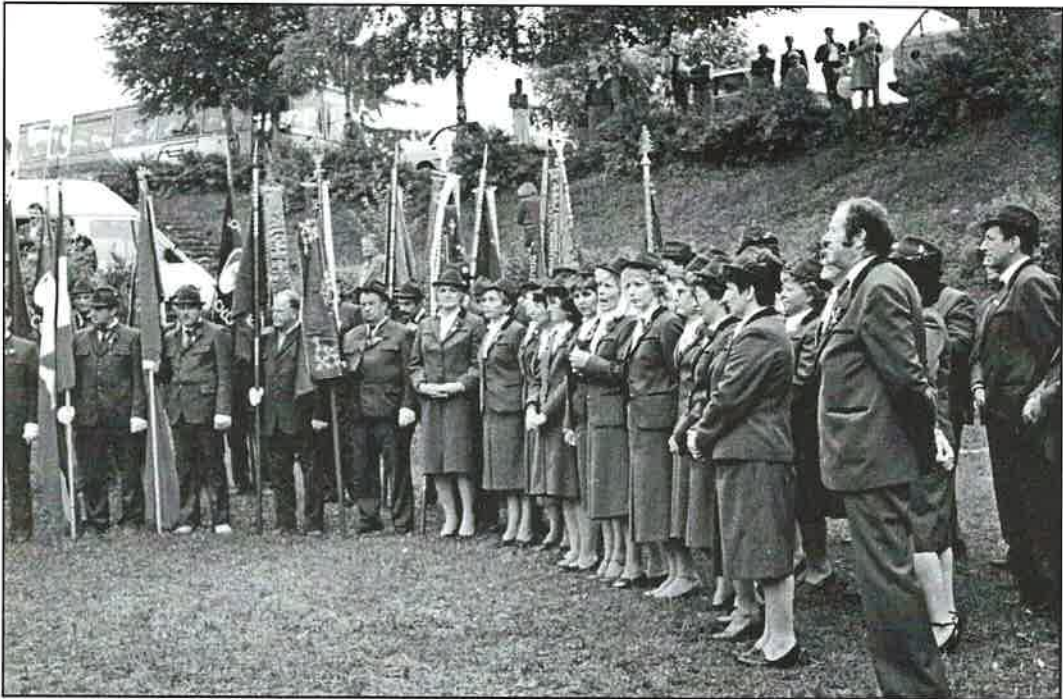
Črnomelj, 14. lipnja 1986. - Zbor je tada nastupio prvi puta na Srečanjima lovskih pevskih zborov in rogistov Slovenije.

manifestacijama Radničko - kulturno stvaralaštvo, kada se ta manifestacija gasi. Toj manifestaciji Zbor je u više navrata i domaćin.