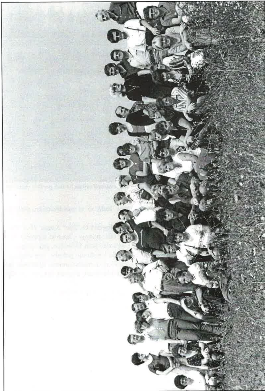
Članovi Zbora na izletu u Kopački rit prigodom gostovanja u Iloku, rujna 1982. godine.